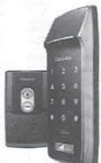
▲テンキーがアットランダムに表示

ユーエムイー(東京都港区)は賃貸住宅へのインターネット導入を提案を展開している。また、同商品を設置したドアは、オートロック設定ができる。オートロック機能のON/OFF切り替えは、iPadに利用している液晶タッチパネル式を採用。画面に触れるだけで操作が行える。同商品は、タッチするたびにアットランダムに数字が表示される。暗証番号を特定されにくくなる工夫もされている。