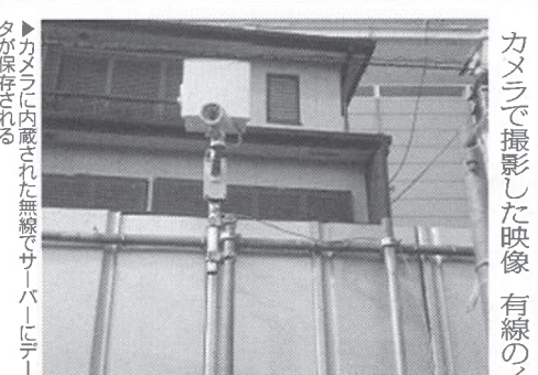
▲カメラに内蔵された無線でサーバーにデータが保存される

通信インフラ事業を展開するキッズウェイ(東京都豊島区)は、防犯カメラシステムを展開している。カメラ自体が無線でインターネット回線につながるため、電源コンセントさえあればどこでも設置が可能だ。有線のインターネット回線も必要ない。