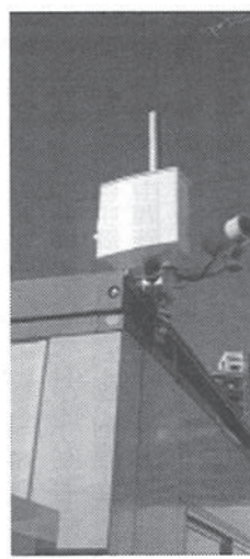
▲電源は設置が可能

別個所に設置された複数台のカメラを一つの端末で一度に管理することもできる。万が一、カメラが壊されても、映像はデータセンターで保存されているため失われることはない。また、赤外線カメラを使用し、照明を設置しなくても夜間撮影ができる。万が一、カメラが壊されても、映像はデータセンターで保存されているため失われることはない。